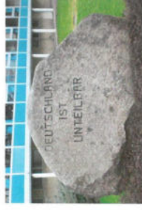
Gedenkstein des Ortskuratoriums Unteilbares Deutschland Offleben

Die vierte Station der Grenzwanderung befindet sich am Ortsausgang Offlebens in Richtung Barneberg. An dieser Stelle werden die Schließung der Grenze und die Öffnung derselben thematisiert, wobei auch der stetige Ausbau der Grenzsicherung Berücksichtigung findet.