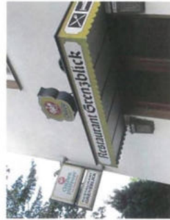
Relikte vergangener Zeiten. Die ehemalige Gaststätte »Grenzblick«

Die besondere Lage beider Dörfer (Offleben und Hötensleben) ermöglicht es zwei Sichtweisen, eine westliche und eine östliche auf die ehemalige innerdeutsche Grenze, einzunehmen. Die Grenzwanderung Offleben und das Grenzdenkmal in Hötensleben sind durch den Kolonnenweg (circa 2 km Fußweg) miteinander verbunden und können nacheinander erkundet werden.