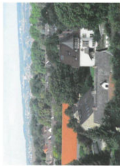
Offleben, im Hintergrund Schönningen