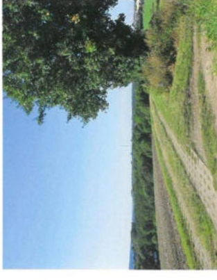
Der Kolonnenweg bei Offleben. Im Hintergrund rechts Rensdorf, geradezu das Braunkohlekraftwerk Buschhaus.

Im Jahr 2011 begann in Zusammenarbeit mit dem Grenzdenkmalverein Hötensleben die völlige Überarbeitung der bisherigen Tafeln, um eine einheitliche Darstellung zu schaffen.