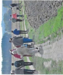
Während einer Grenzwanderung bei Offleben